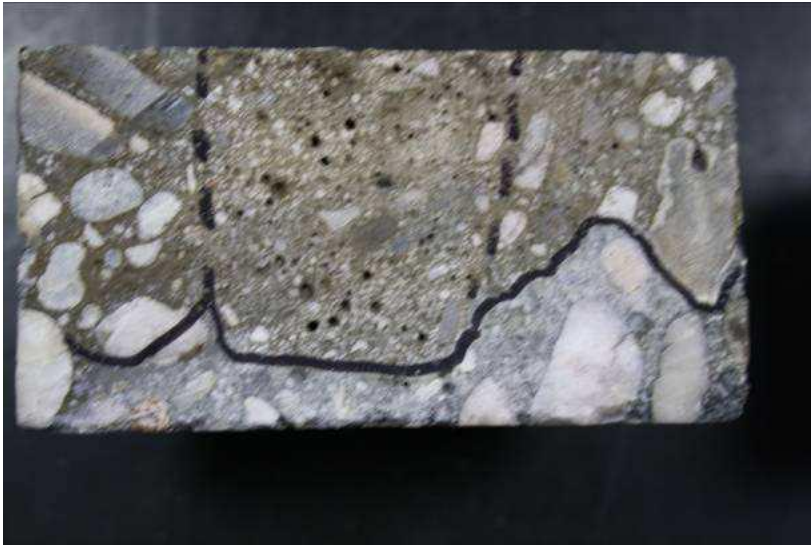
CEM III/B 42,5 N