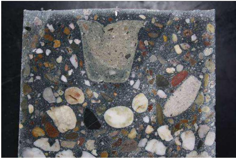
Foto1, doorsnede kubus

een afstand van de afstandhouder tot aan het beproevingsoppervlak aangehouden van ongeveer 1 cm (foto 2).