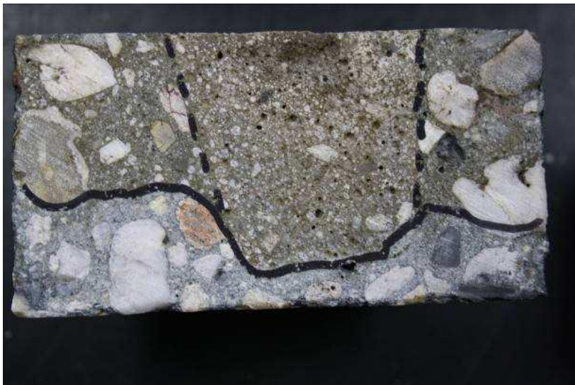
CEM III/B 42,5 N

Gezien de specifieke aard van deze combinatie heeft het geen zin om een waarde aan de combinatie te geven daar in deze proefopstelling de afstandhouders ongeveer 30% van het totale volume van het proefstuk innemen. Bij praktijkgebruik zal dit vele malen kleiner zijn. Voor een indruk van de invloed van de afstandhouders zijn er foto's gemaakt van het indringingsprofiel zoals weergegeven in onderstaande foto's.