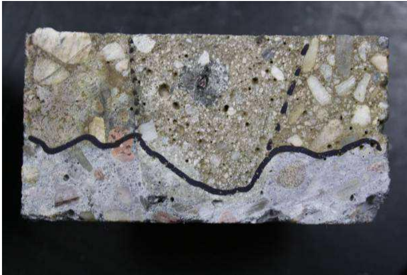
CEM I 52,5 R